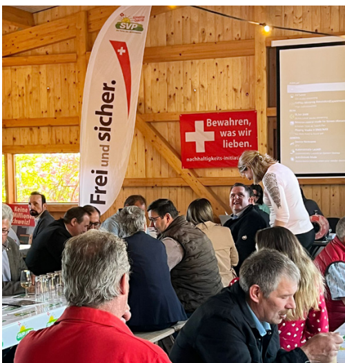
Gutbesuchte Jahresversammlung im Wahlkreis Hochdorf