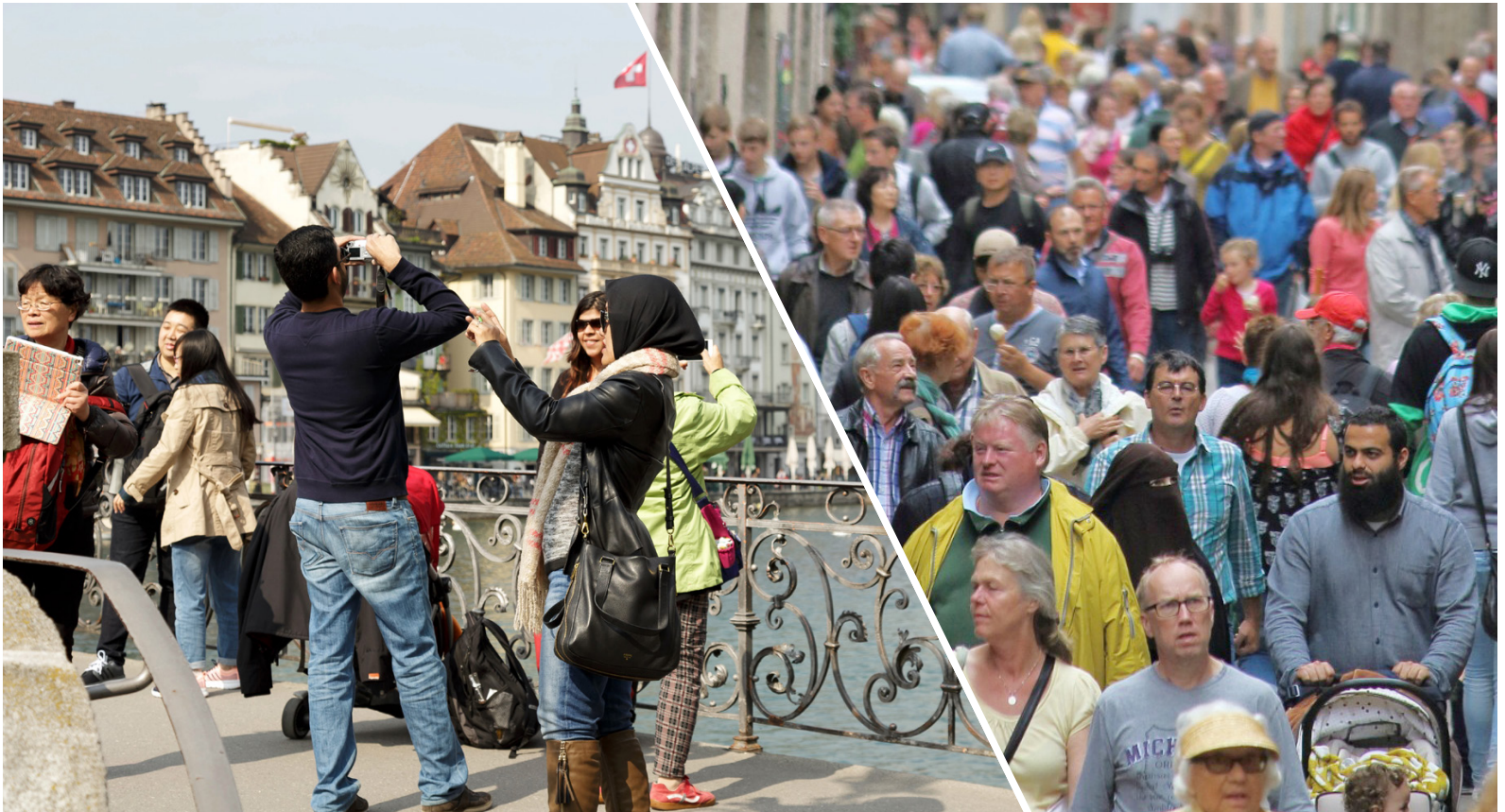
Luzerner SP in Schiefelage: Initiative fordert die Begrenzung der Hotelbetten, aber keine Massnahmen bei der dauerhaften Zuwanderung.

„WÄHREND DIE SP IM TOURISMUS KLARE GRENZEN SETZEN WILL, LEHNT SIE BEI DER DAUERHAFTEN ZUWANDERUNG JEGliche BEGRENZUNG AB.“