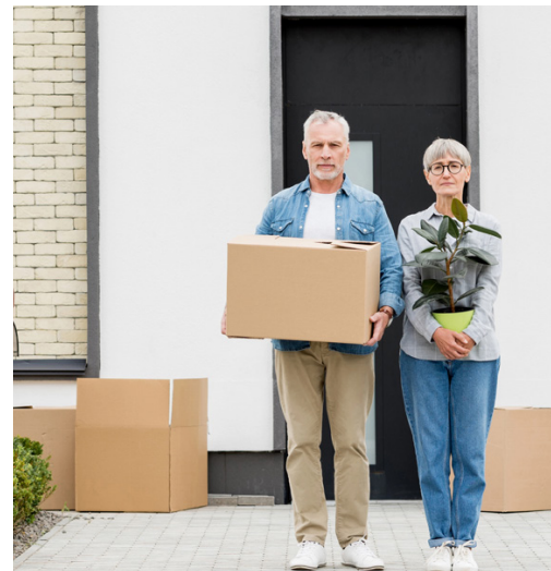
«Unterbelegung»: der Bundesrat zielt besonders auf selbstbewohnte Eigenheime älterer Menschen.

bleiben. Es ist ihr Lebensmittelpunkt, oft über Jahrzehnte gewachsen. Die Umzugsquote ist entsprechend tief. Gleichzeitig fehlen passende und bezahlbare Alternativen. Wer heute sein Haus verkaufen würde, findet kaum eine kleinere, erschwingliche Wohnung im gleichen Umfeld. Trotzdem wird nun darüber nachgedacht, wie man mehr Wohnraum aus diesen Grundstücken herausholen kann. Damit stellt sich eine grundsätzliche Frage: Seit wann entscheidet der Staat, wie viel Platz jemand haben darf? Die Wohnungsnot ist unbestritten, doch ihre Ursachen sind bekannt. Es wird zu wenig gebaut, die Vorschriften werden immer dichter und die Verfahren dauern zu lange. Hinzu kommt eine anhaltend hohe Zuwanderung, die den Druck zusätzlich erhöht. Genau hier läge der Hebel, wenn man die Situation wirklich entschärfen wollte. Stattdessen entsteht der Eindruck, dass die Konsequenzen des Bevölkerungswachstums nicht an der Wurzel angegangen, sondern nach innen verschoben werden. Nicht die Politik soll sich anpassen, sondern die Eigen-